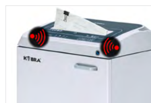
METAL DETECTION SYSTEM SHRED GUARD

Il sistema Shred Guard ferma il distruggidocumenti quando rileva oggetti metallici di grandi dimensioni, tali da poter danneggiare i coltelli di taglio. Un indicatore luminoso avverte l'operatore della necessità di rimuovere questi oggetti.