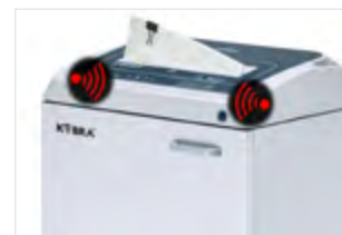
METAL DETECTION SYSTEM SHRED GUARD

Oliatore automatico integrato per la lubrificazione dei coltelli di taglio. Non richiede manutenzione ed è in grado di dosare automaticamente la quantità di olio necessaria durante il funzionamento.