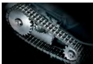
SUPER POTENTIAL POWER UNIT

Robusta trasmissione a catena con ingranaggi in acciaio per la massima resistenza e affidabilità. Coltelli in acciaio temprato ad alto tenore di carbonio.