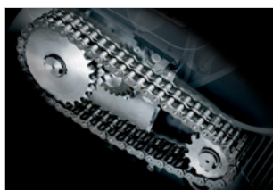
SUPER POTENTIAL POWER UNIT

Robusta trasmissione a catena con ingranaggi in acciaio per la massima resistenza e affidabilità. Coltelli in acciaio temprato ad alto tenore di carbonio.