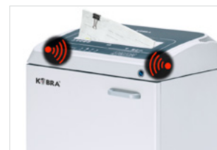
METAL DETECTION SYSTEM SHRED GUARD

Oliatore automatico integrato per la lubrificazione dei coltelli di taglio. Non richiede manutenzione ed è in grado di dosare automaticamente la quantità di olio necessaria durante il funzionamento.